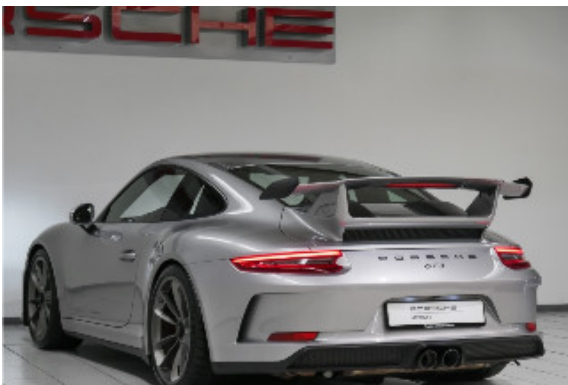
Porsche Zentrum Bremen