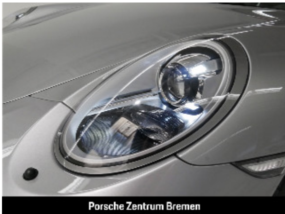
Porsche Zentrum Bremen