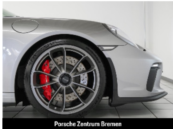
Porsche Zentrum Bremen