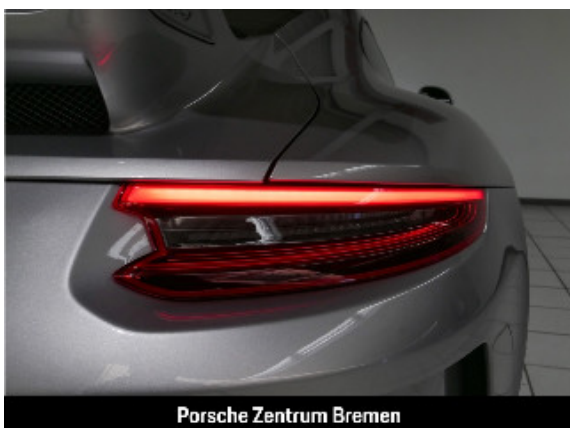
Porsche Zentrum Bremen