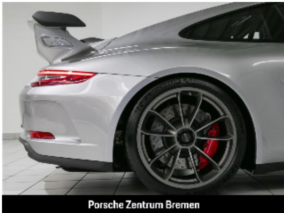
Porsche Zentrum Bremen