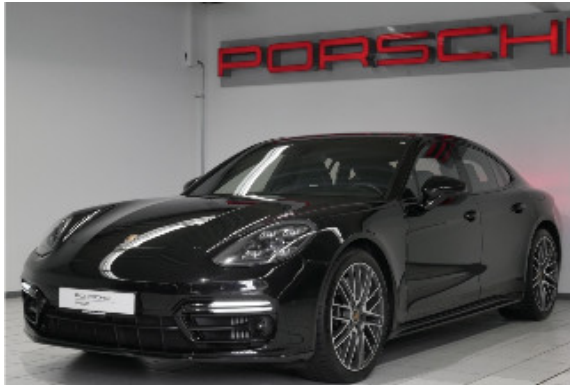
Porsche Zentrum Bremen