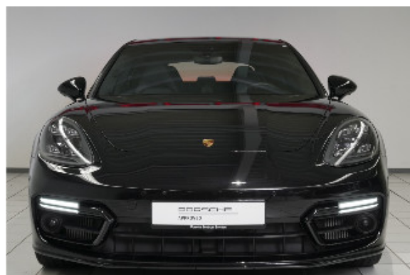
Porsche Zentrum Bremen