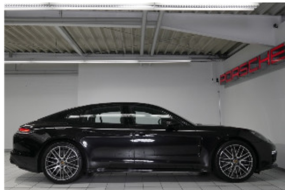
Porsche Zentrum Bremen