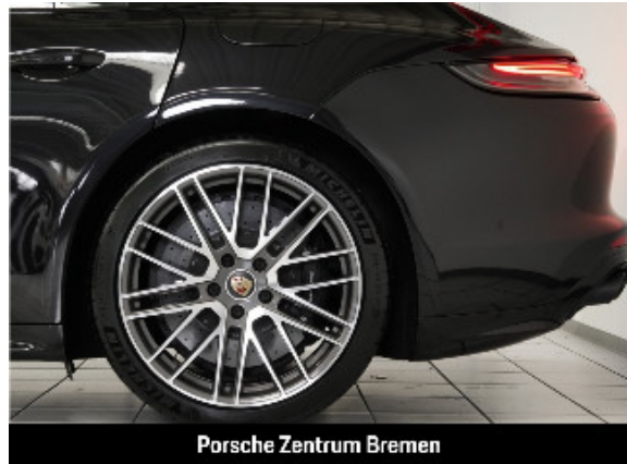
Porsche Zentrum Bremen