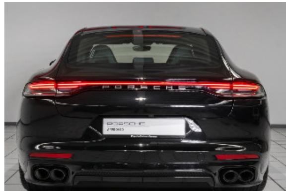
Porsche Zentrum Bremen