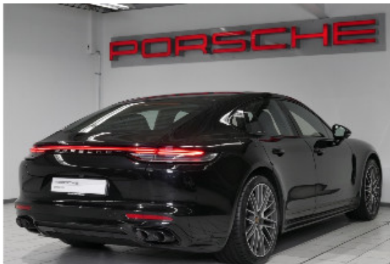
Porsche Zentrum Bremen