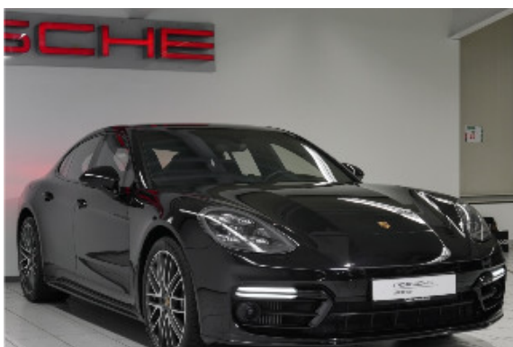
Porsche Zentrum Bremen