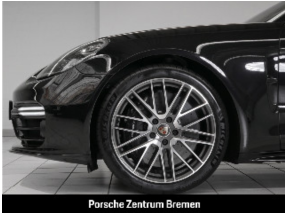
Porsche Zentrum Bremen