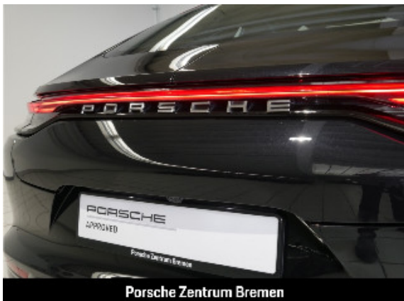
Porsche Zentrum Bremen