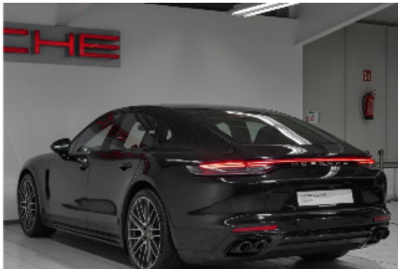
Porsche Zentrum Bremen