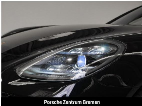
Porsche Zentrum Bremen