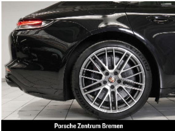
Porsche Zentrum Bremen