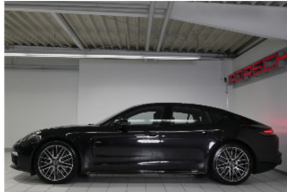
Porsche Zentrum Bremen