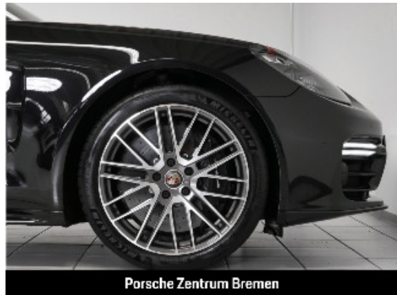
Porsche Zentrum Bremen