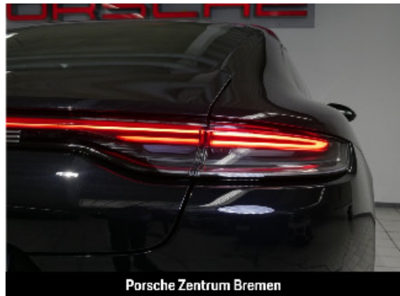
Porsche Zentrum Bremen